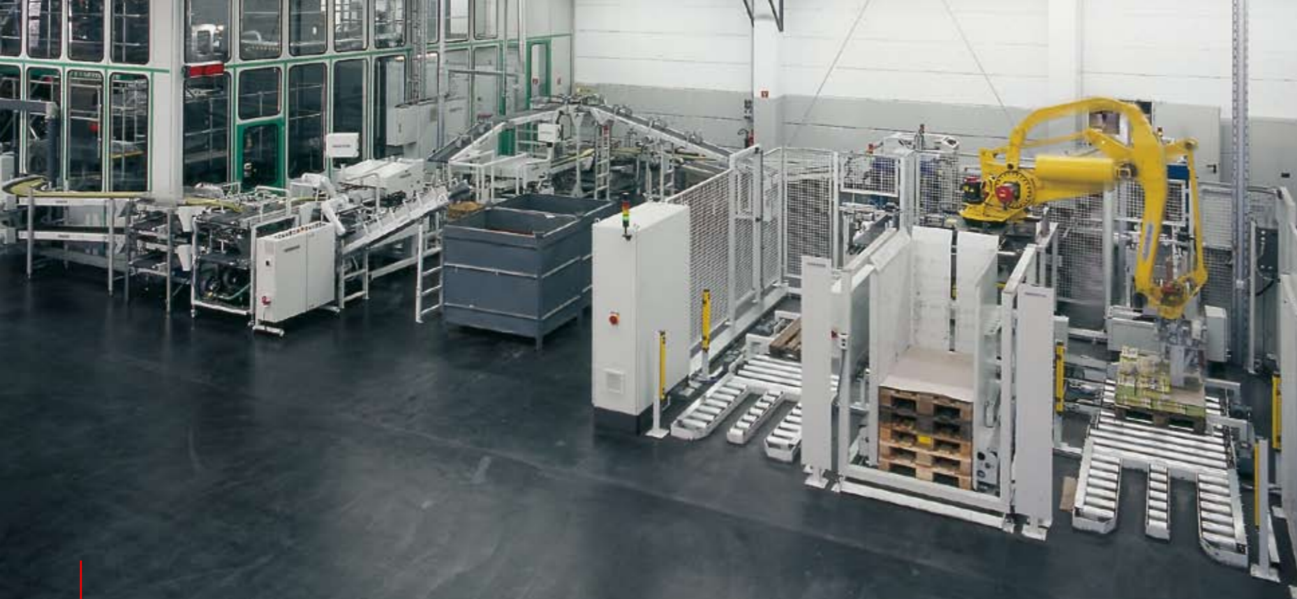
Gesamtansicht der Post Press Anlage mit Heavy Duty Förderlinien, RS 800 Rotationsschneidern, RS 32 Kreuzlegern, RS 110 Verblockern, Umreifungsmaschinen und RS 400 Palettierroboter. Die Umlenkung des Schuppenstroms erfolgt über RS 220 Eckumlenkungen und einen RS 230 Turm (Kombination aus Ecke und Kurve).

Die Schuppenströme der beiden A4-Auslagen werden von zwei übereinander liegenden Heavy-Duty-Förderlinien zu zwei RS 800 Rotationsschneidern transportiert. Bei Bedarf kann der obere Schuppenstrom bei Sonderformaten über eine Weiche für einen zweiten Beschnitt in den unteren Rotationsschneider gewechselt werden. Über eine zentrale Makulaturweiche vor dem Schneidbereich wird Anfahr-, Wasch- und Klebemakulatur ausgeschleust.